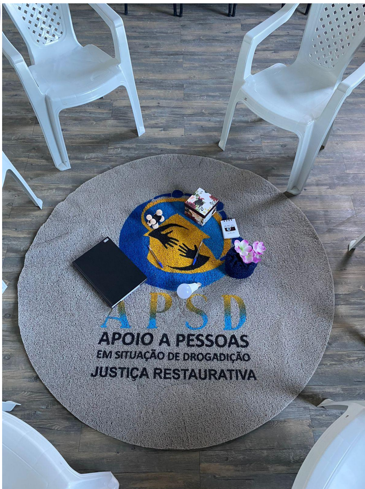
Tapete especial de nosso Pojeto