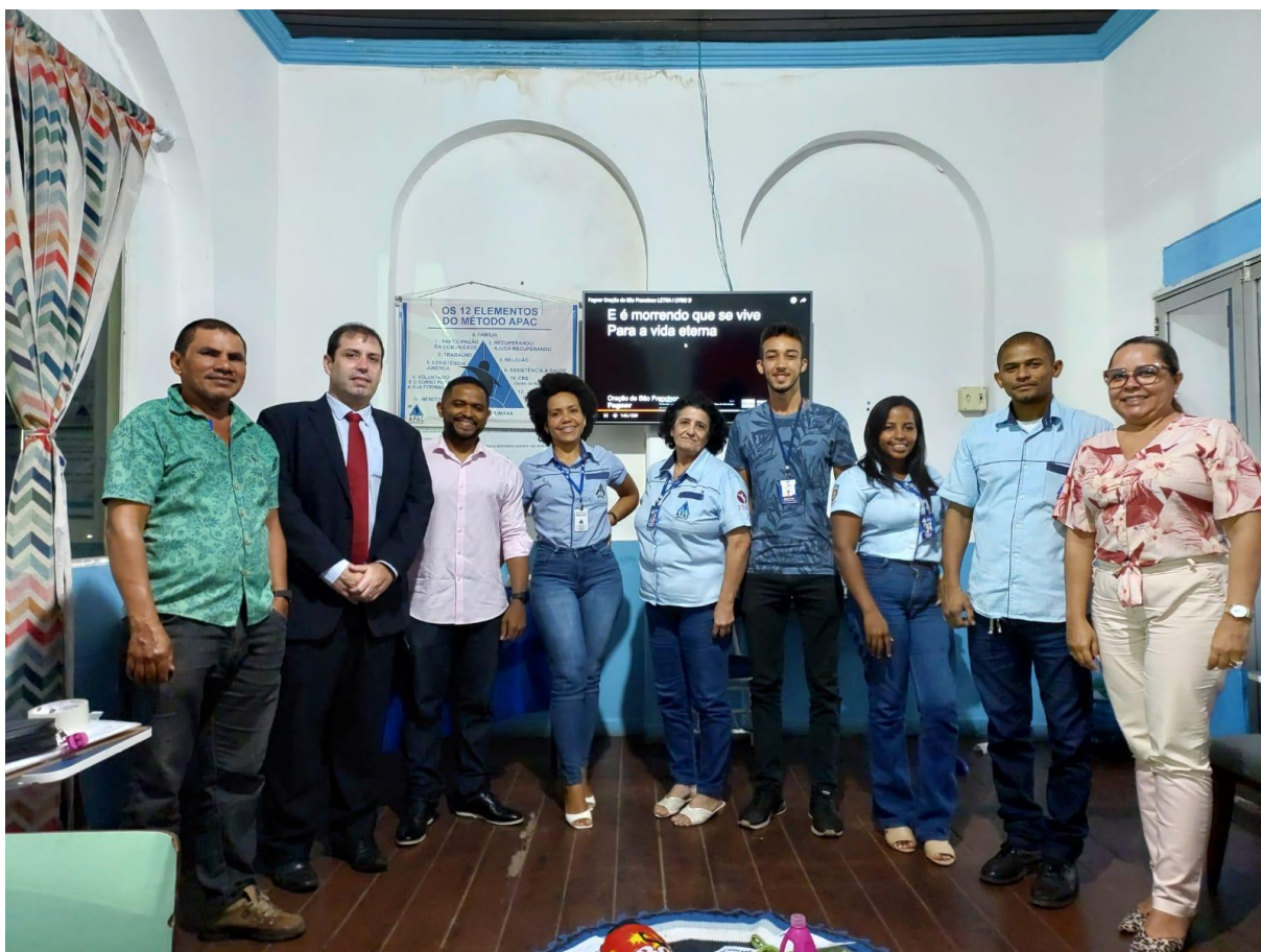
Reunião com os facilitadores