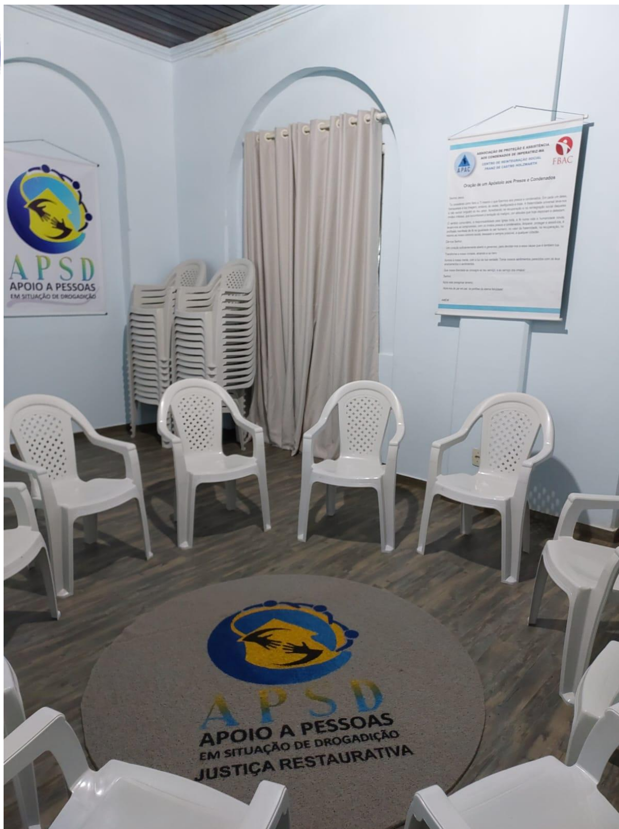
Sala local de reuniões estabelecido exclusivamente para este projeto – situado na APAC de Imperatriz