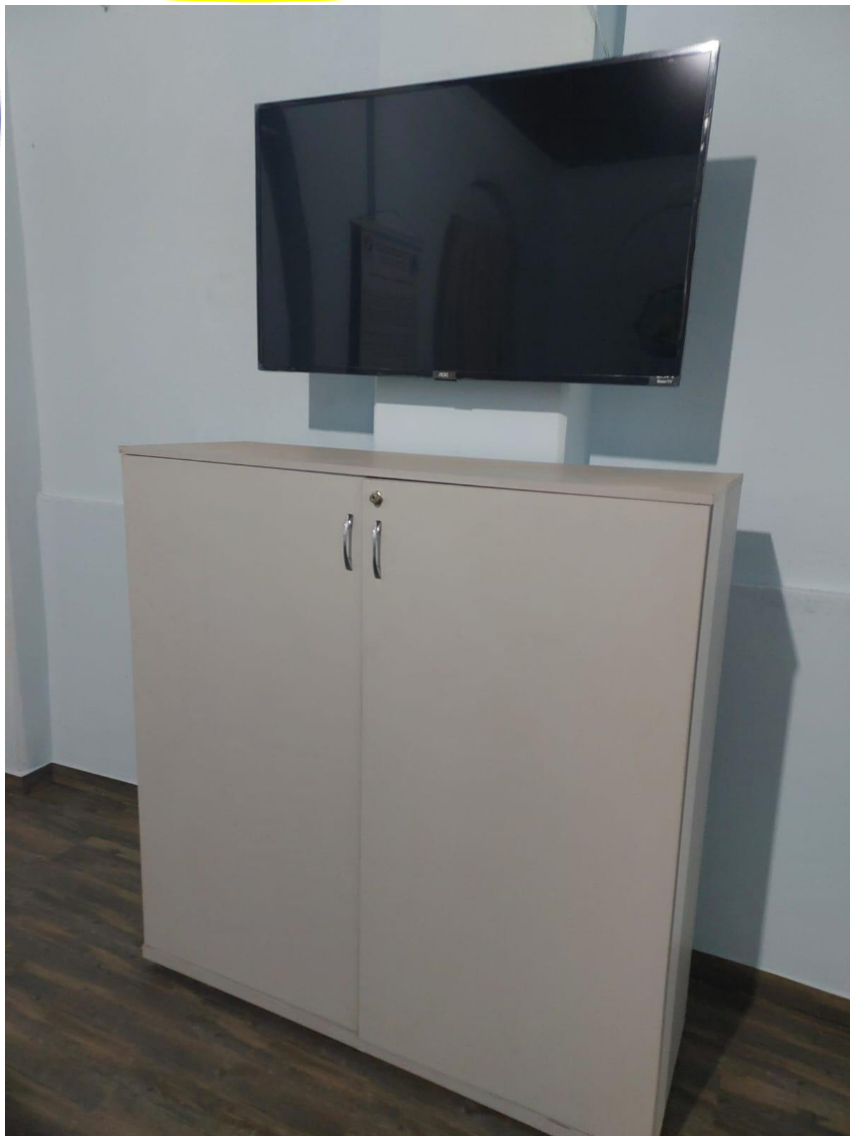
Moveis adquiridos por meio de edital para o projeto