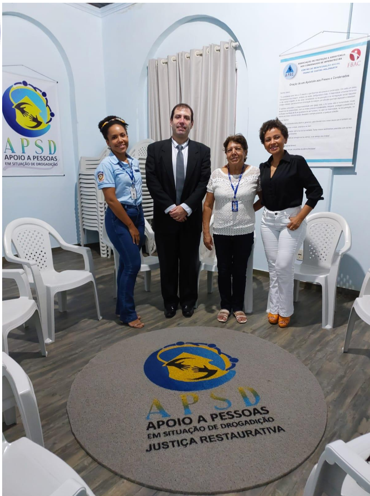
Juiz de direito e Facilitadoras certificadas, atuantes na APAC