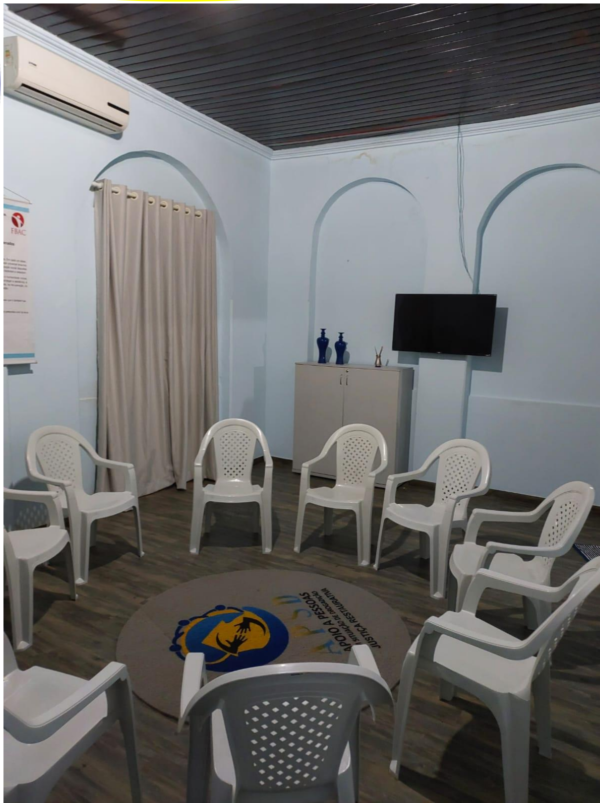
Estrutura e moveis para o uso de nossas reuniões